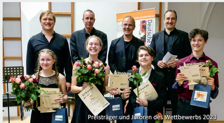
Preisträger und Juroren des Wettbewerbs 2023

Wir sind auch auf Facebook: www.facebook.com/WetzlarerKlarinettenWettbewerb